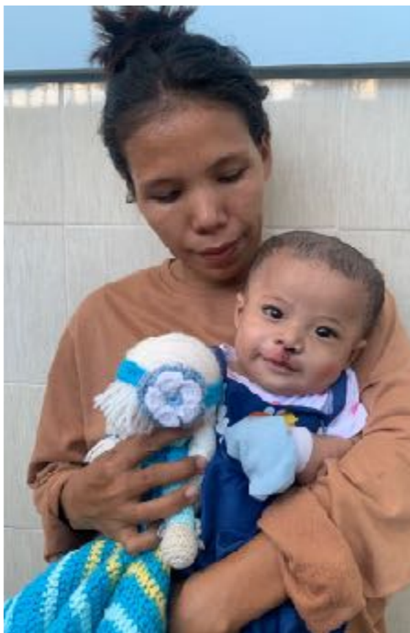
Een liefdevol gebaar in de vorm van plastische chirurgie verandert alles in het leven van een kind, geboren met een schisis: een toekomst met een glimlach.