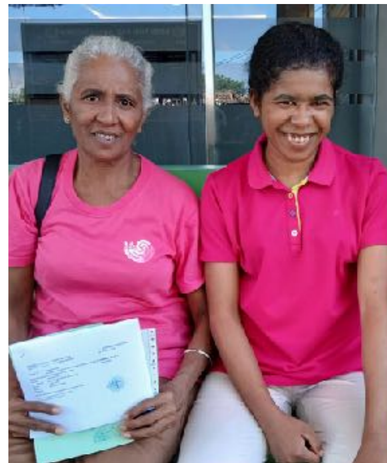
Moeder en dochter hulp bieden bij de behandeling van een aangeboren afwijking als anusatresie, verandert hun beider leven na jaren van pijn, zorgen en verdriet. Hoop op een toekomst met een glimlach voor het hele gezin.