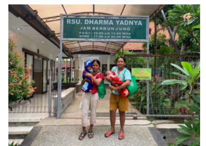
Al jaren is er een goede Samenwerking tussen het Dharma Yadnya Hospital en Kolewa Foundation.