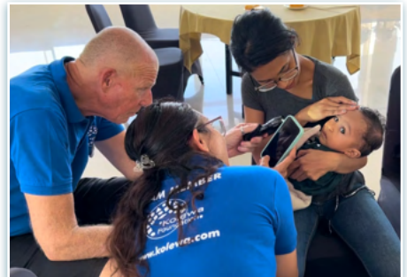
Uttari en Koos gaan van start met het monitoren van o.a. de conditie van het gehemelte na de operatie