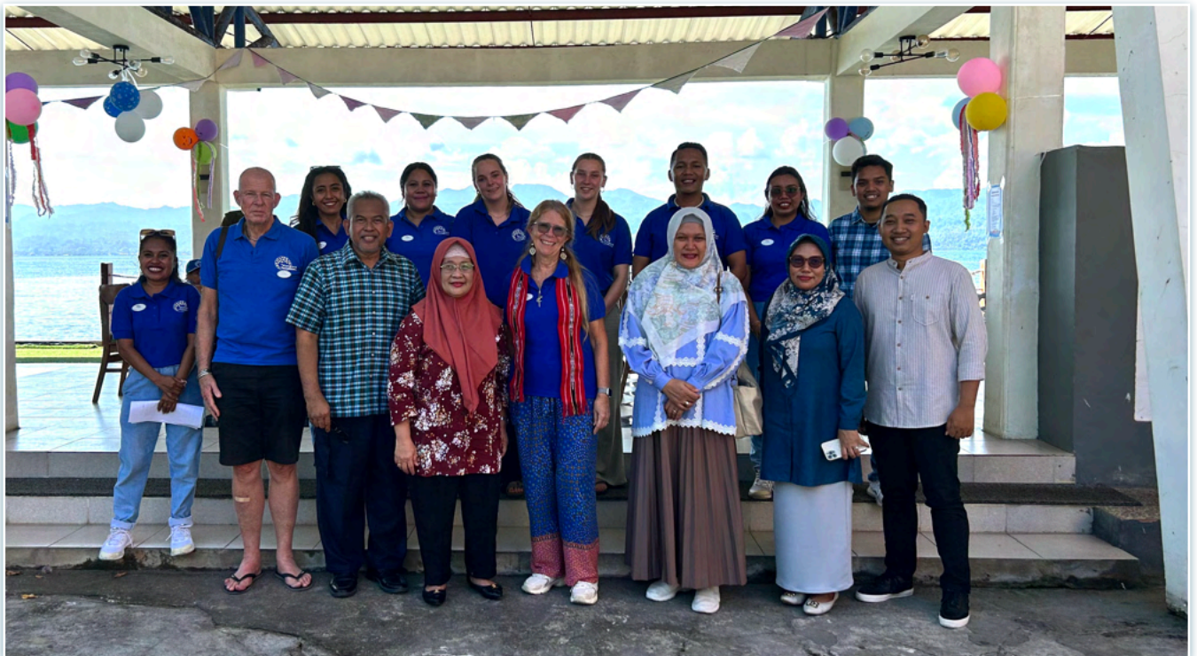
Het vastleggen op de gevoelige plaat mag nooit ontbreken, hierna sloten we het officiële gedeelte af.